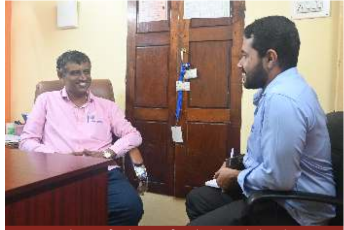
ಸಂಚಿಕೆಯ ವಿಶೇಷ ಸಂದರ್ಶನ

ಸಂದರ್ಶಕರು : ವಾರ್ತಾಪತ್ರಿಕಾ ಸಂಪಾದಕೀಯ ಮಂಡಳಿ